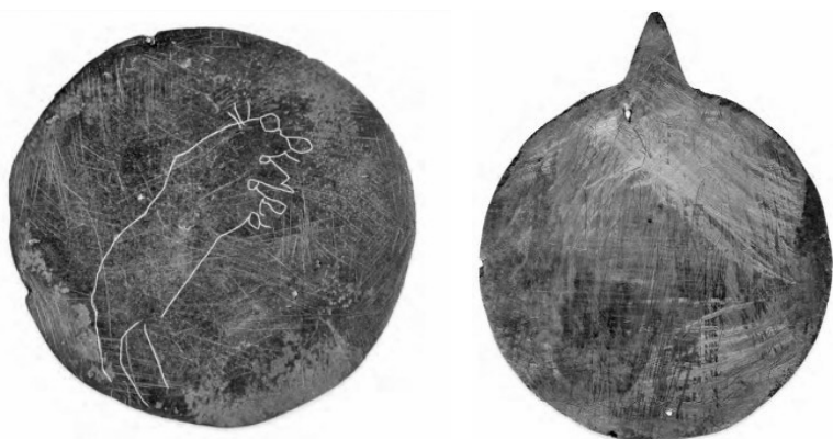
Рис. 3. Бронзовые предметы ритуального назначения — бляха с граффити и зеркало — с многочисленными царапинами [4, с. 130, 192]

ружены деревянные предметы ритуального назначения с процарапанными на них изображениями (рис. 4), в том числе полочки для культовых предметов [12]. Возможно, о подобных полочках идет речь в вышеприведенной цитате из А. Каннисто. Следовательно, упомянутые артефакты могут быть досками / полками, по которым стучали и скребли стрелами во время шаманского сеанса в темном доме.