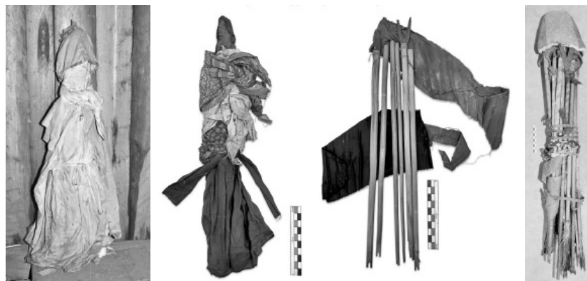
Рис. 1. Идолы, изготовленные на основе связок стрел [3, с. 87, рис. 45, с. 94, рис. 52, с. 114, рис. 81]

Основные сферы обрядовой деятельности хантов и манси, где ритуальные стрелы выступают в качестве фоноинструмента, — медвежий праздник и шаманский сеанс в темном доме. В. Н. Чернецов в 1930-е годы зафиксировал мансийский обычай собирать людей на медвежий праздник с помощью стрел: «Вечером, перед началом танцев, по всем домам поселка ходят два человека (обычно в сопровождении ребят). У каждого — стрела, украшенная полосками сукна, колокольчиками. Они потрясают стрелами и кричат три раза. Это — знак, что Ялп ус ойка (дух-покровитель. — Г. С.) созывает народ в йек кол (дом для обрядов, букв. «танцев дом». — Г. С.) на танцы» [9, с. 239].