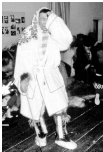
Рис. 2. Певцы на медвежьем празднике: с посохом (слева) и стрелой (справа).